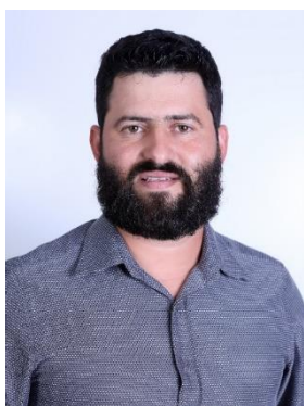
Presidente Lauricio Bitello - PDT

Composição para a comissão durante a 4ª Sessão Legislativa da 6ª Legislatura.