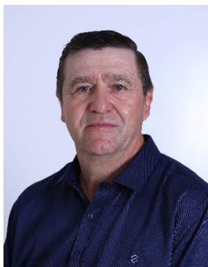
Presidente Sergio Celso Tasso - PT

Composição para a comissão durante a 4ª Sessão Legislativa da 6ª Legislatura.