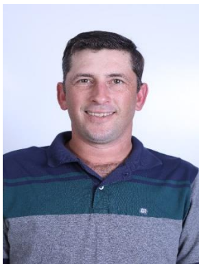
Presidente Adair Witter Friedrich - PDT

Composição para a comissão durante a 4ª Sessão Legislativa da 6ª Legislatura.